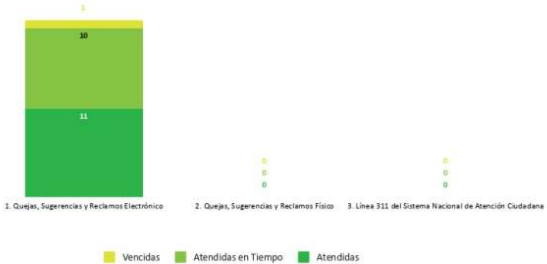
Gestión de Quejas y Sugerencias | Septiembre 2023